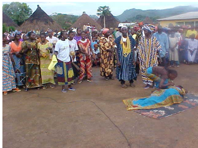
Concours de musique à Sengbedou (Macenta)

Dans la commune de N'Zérékoré, nous avons procédé à la distribution des dictionnaires aux élèves de 7ème et 8ème. Environ 2.000 élèves ont bénéficié de ces dictionnaires bien qu'il reste une école où la répartition n'est pas encore terminée.