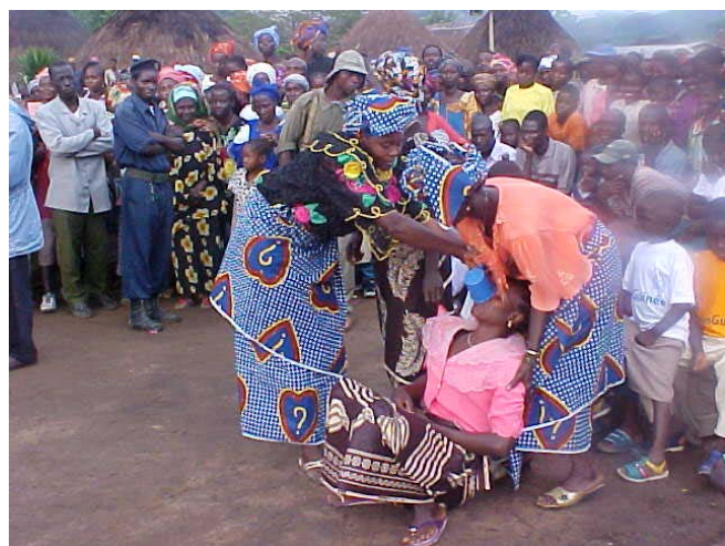
Un groupe musical traditionnel