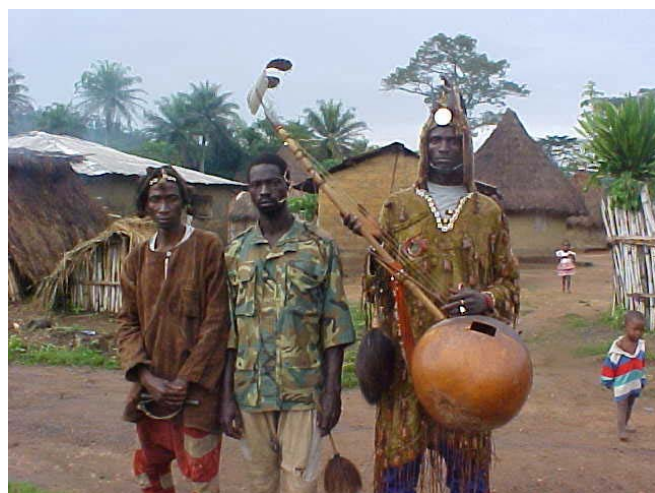
Prestation d'un groupe de chasseurs au cours du concours de musique

A Macenta, la mise en place des parlements sous/préfectoraux et préfectoraux des enfants a été effectuée. Tellement ce travail a intéressé les autorités de la préfecture, le Préfet de Macenta a mis à la disposition des représentants préfectoraux des jeunes parlementaires un local pour leur servir de bureau et cela dans les locaux de la préfecture.