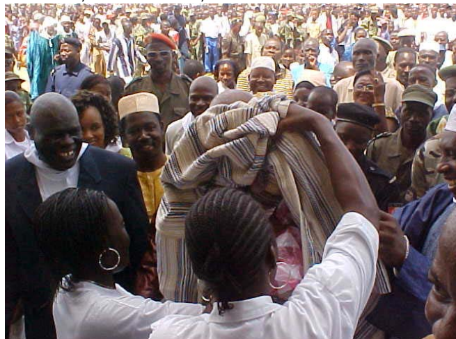
Remise d'un boubou à Monsieur le Ministre de l'Education Nationale lors de l'inauguration des écoles en étages à Guéckédou