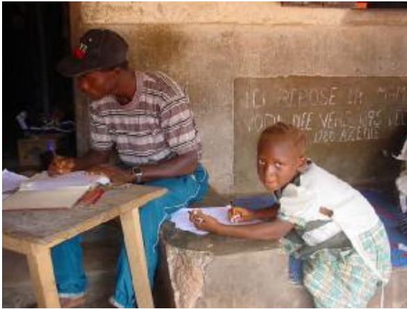
Un animateur communautaire remplit la lettre d'affiliation

Ü Ceux qui décident de devenir partenaires pour la communication – Ces derniers ont soif de communiquer avec des gens qui vivent dans un autre monde différent de leur. Ils se découragent vite s'ils ne reçoivent pas leurs communications (lettres, rapports etc....) à temps.