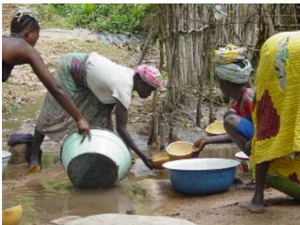
PlanGuinée L'eau potable est défi communautaire

Lors de la visite qu'a effectué le Directeur des Communications à Kassadou, les remarques d'une manière générale dans la CRD ne sont pas encourageantes. Tous les puits scolaires ont tari d'où le besoin de construire des impluviums dans certains établissements scolaires et sanitaires.