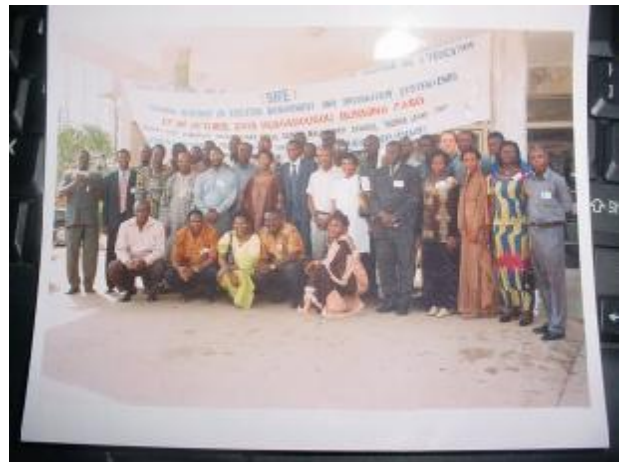
Les représentants des différents pays