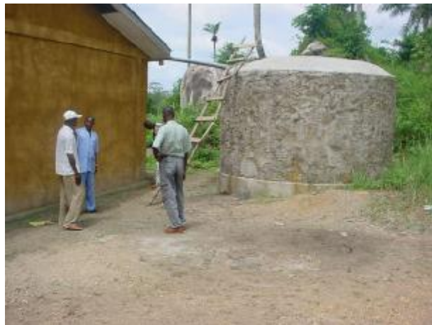
L'impluvium du Collège de Kassadou

Parlant de l'avantage de ces impluviums dans ces différents lieux, le Conseiller en eau et assainissement de Plan Guinée a dit que : Pour la réalisation des travaux, près de 50% des matériaux utilisés se trouvent sur place ; la technologie de construction est accessible aux ouvriers qualifiés locaux.