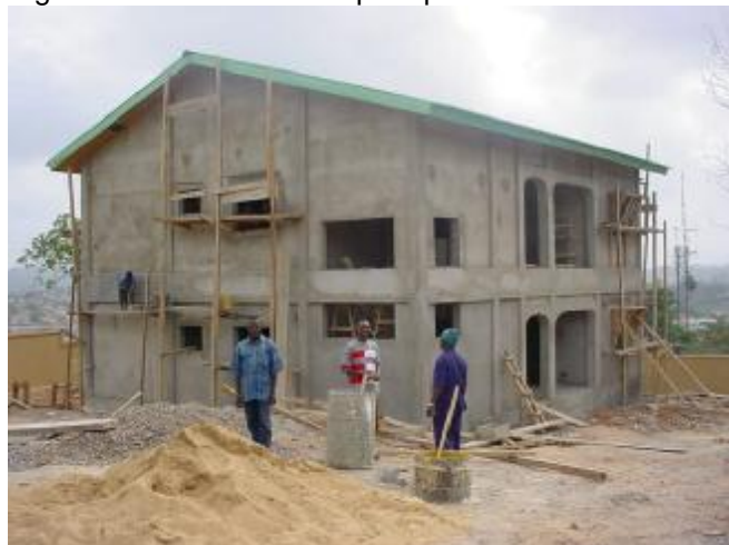
La Direction Préfectorale de L'Education de Gueckédou en construction

Plan Guinée et aux lecteurs de PARTENARIAT pour leur participation active à la vie de ce moyen de communications et les invite de nous envoyer régulièrement des articles pour publication.