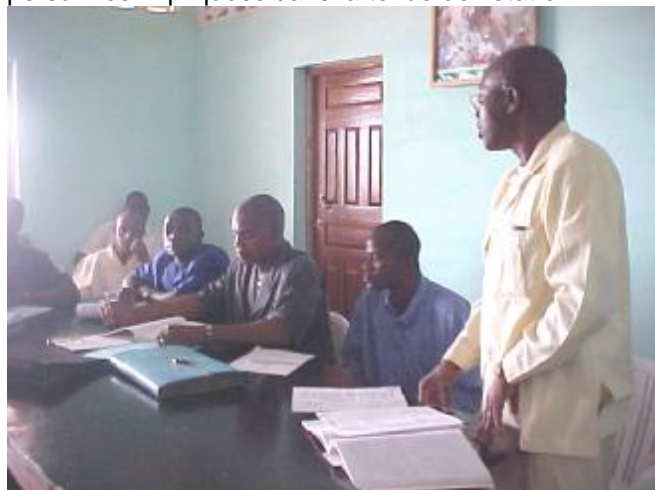
Séance de travail

A près une formation des chargés ( Secrétaires communautaires, le Général de la commune), officiers de l'état civil ( Présidents des CRD, Maire de la commune ) et toutes les personnes impliquées dans la tenue de l'état civil.