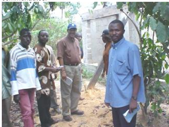
Visite de latines à Bowé

S P : Je pense que grâce à cette motivation, les inscriptions à l'école vont sûrement augmenter et en particulier celles des jeunes filles. En plus, cette activité encourage les enfants à rester à l'école. Elle améliore la performance, crée la motivation et stimule la concurrence. Cependant, je recommande la prudence et un strict suivi de son évolution en mesurant à sa juste valeur son impact dans les communautés.