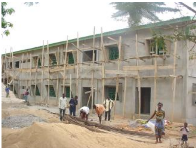
L'hôpital de Gueckédou reconstruit avec l'appui de l'USAID

Aussi, nos pairs qui nous visitent n'ont pas manqué de faire des éloges mérités sur notre façon de travailler en tant que membres d'une famille qui visent les mêmes objectifs, c'est à dire le développement communautaire où toutes les composantes sont réellement impliquées à tous les niveaux et dans tous les domaines, de la conception à la finition.