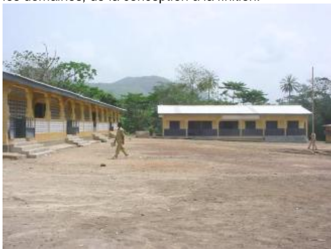
Le Collège de Kondiadou

Aussi, nos pairs qui nous visitent n'ont pas manqué de faire des éloges mérités sur notre façon de travailler en tant que membres d'une famille qui visent les mêmes objectifs, c'est à dire le développement communautaire où toutes les composantes sont réellement impliquées à tous les niveaux et dans tous les domaines, de la conception à la finition.