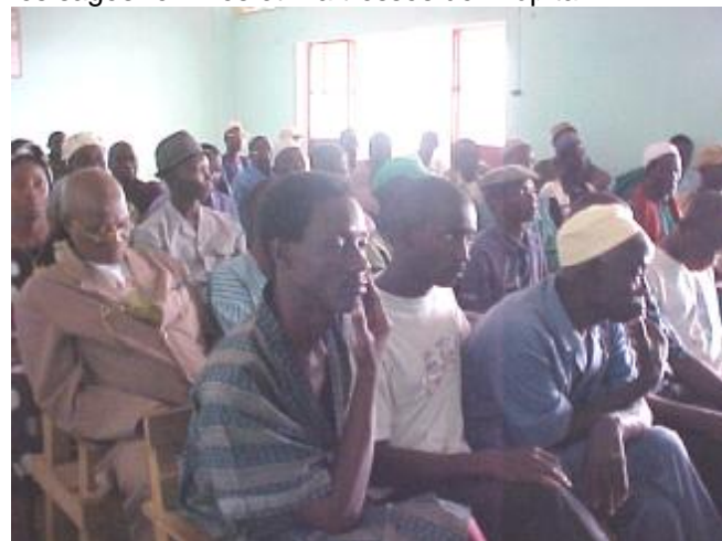
Les participants à la commune

Tour à tour, la mission s'est basée sur le nombre des naissances et des cas de décès de l'exercice 2002 à 2003 ( Janvier-décembre 2003 ). Plus de 4.000 extraits de naissance ont été délivrés.