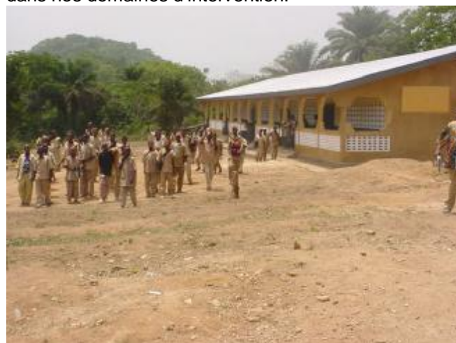
Le Collège de Waltö a ouvert ses portes le 29 janvier 2004

Mesdames et Messieurs, nous vous invitons, en tant qu'acteurs assidus et engagés, à parler de vos activités quotidiennes dans lesquelles nous nous sommes engagés ensemble pour réaliser les vision et mission de Plan pour que le Développement Communautaire Centré sur l'Enfant (DCCE) réussisse dans nos domaines d'intervention.