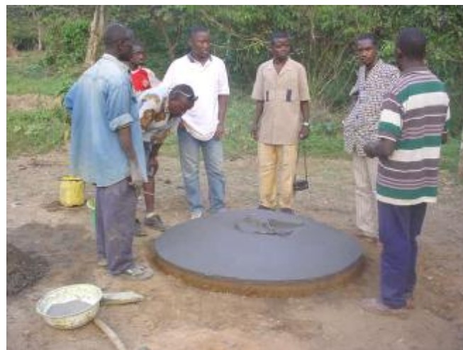
Construction de 200 dalles pour latrines à Bowé centre. Collaboration UNICEF/ Plan Guinée/ AACG

Nous n'oublions pas de mentionner nos relations privilégiées avec les Institutions Internationales telles que la Banque Mondiale (BM), l'UNICEF et l'USAID quand celles-ci nous confient des projets d'envergure