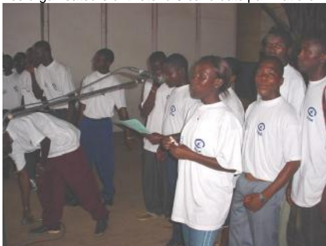
Les membres du Club

Les postulants venus de l'école primaire de Gonja 1, des collèges de Bethléem, Gonja 1 et 2, Samory, Alpha Yaya DIALLO et Fakoly ont compétiti dans plusieurs matières dont : Dictée/ questions, Histoire, Géographie, culture générale centrée sur le SIDA, la connaissance de la Guinée et des écrivains africains. Les organisateurs ont retenu 6 candidats par matière.