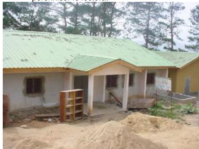
La bibliothèque préfectorale de Gueckédou en rénovation

Mesdames et Messieurs, nous vous invitons, en tant qu'acteurs assidus et engagés, à parler de vos activités quotidiennes dans lesquelles nous nous sommes engagés ensemble pour réaliser les vision et mission de Plan pour que le Développement Communautaire Centré sur l'Enfant (DCCE) réussisse dans nos domaines d'intervention.