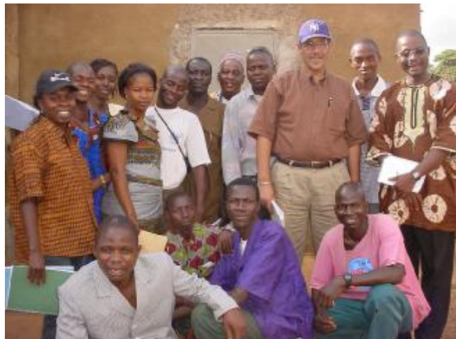
La délégation avec les membres de G.A Co.B.O à Yomou

A Yomou, nos visiteurs ont été accueillis à bras ouverts par les responsables et membres de notre ONG partenaire GACOBO. Tous les outils, méthodes, techniques et tactiques concernant les animations villageoises ont été expliqués au dernier détail à nos visiteurs Léonais dans un esprit d'ouverture dont seul Plan a inculqué le secret aux membres de sa grande famille en Guinée.