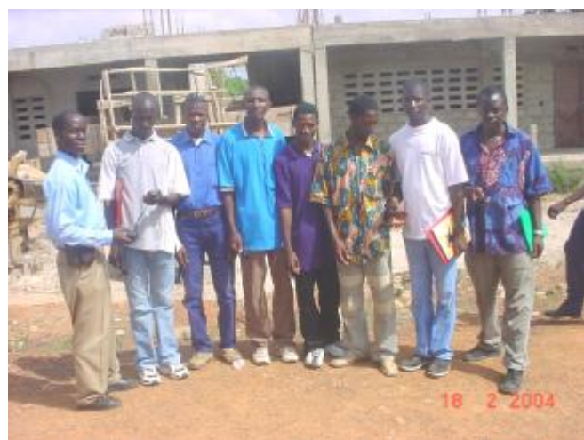
Superviseurs de West lors de la séance pratique au Lycée Félix Roland MOUNIE

L'objectif de ce module était d'initier le personnel d'encadrement technique des projets cofinancés par les communautés et Plan Guinée (Superviseurs techniques et conseiller en eau) à la manipulation du GPS et au transfert de données du GPS à un logiciel de cartographie.