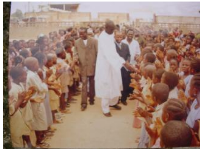
Le Coordinateur National de Plan Guinée en compagnie du Maire de la Commune salue les élèves

Le Conseil des sages, au nom de la population a présenté les traditionnelles noix de colas au nouveau Représentant de Plan en Guinée suivi par des groupes d'associations qui ont émerveillé de part leurs prestations théâtrales sur des numéros portant sur la scolarisation et l'impact de Plan Guinée dans les zones couvertes.