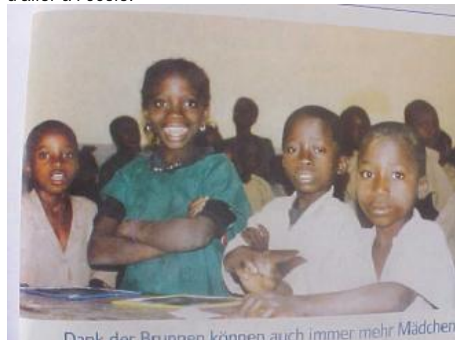
Les enfants au centre du développement

Plus de 60.000 enfants meurent annuellement en Guinée avant l'âge de 5 ans. Moins de 30% des enfants n'atteignent pas la fin du cycle primaire. Souvent, ils sont obligés de participer à alimenter les revenus de la famille. Surtout les jeunes filles ont la lourde tâche de marcher tous les matins plusieurs kilomètres pour porter de l'eau dans des seaux ou bidons. Elles doivent porter entre 40 et 60 litres d'eau par jour pour toute la famille. Cette corvée coûteuse en temps et efforts empêche souvent les jeunes filles d'aller à l'école.