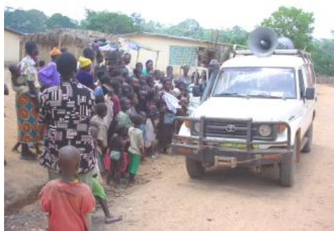
L'équipe pendant la caravane mobile dans la Préfecture de N'Zérékoré

Expliquer aux populations et aux élus locaux les procédures d'enregistrement à la naissance ou de l'obtention du jugement supplétif.