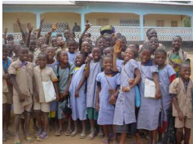
Les élèves de l'école primaire de Vassaiazou ( CRD de Wattanka ). Ecole construite sur fonds propres de la communauté

L'image suivante est le témoignage concret d'une communauté qui est soucieuse de l'avenir de ses enfants en d'éducation ; cette communauté ne disposant donc pas assez de moyens pour construire suffisamment de salles de classes, a aménagé un hangar qui sert de jardin d'enfants.