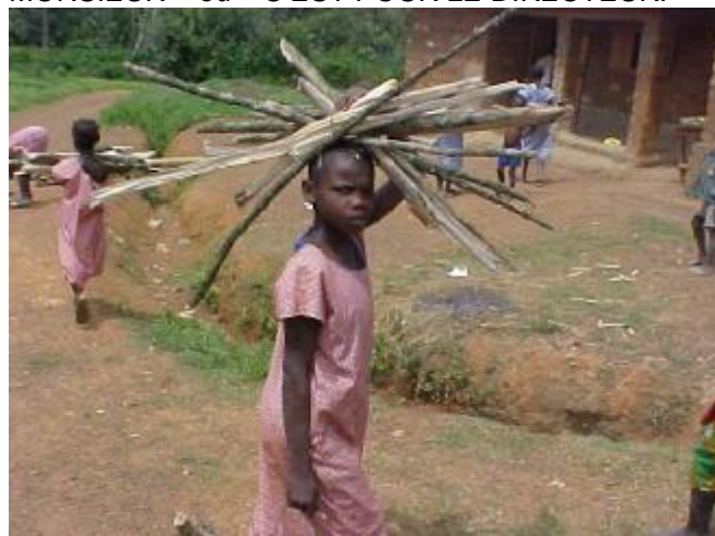
Les enfants sont victimes de l'exploitation

E n sillonnant les écoles en milieu rural il y a un fait qui attire souvent l'attention ; celui de voir les enfants avec les fagots de bois de chauffe, des fagots de roseaux, des paniers de graviers, des seaux d'eau etc. et ce parfois à des heures de cours. À leur poser la question ils te disent tout de suite « C'EST POUR AMENER CHEZ MONSIEUR » ou « C'EST POUR LE DIRECTEUR. »