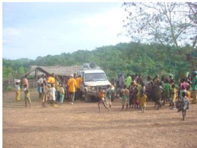
Dans l'une des CRD de Yomou

L a caravane mobile sur la sensibilisation en faveur de l'enregistrement de la naissance et la suite de la prise de contact dans les CRD de Yomou était composé d'une équipe mixte (audiovisuel, agents de collecte et de suivi des comités d'enfants) : les premiers pour la partie technique et les autres pour l'animation.