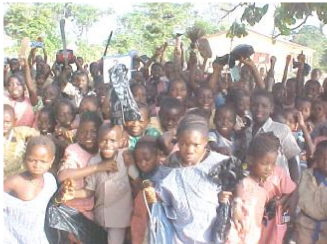
Les écoliers après une séance d'assainissement

Sur cette image, on lit le sourire sur les lèvres de tous les élèves, après une séance d'assainissement.