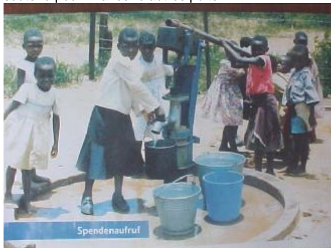
Un des puits réalisés par les partenaires allemands

potable en Forêt. Grâce à la réussite de cette campagne d'appui, il a été possible de financer la construction de plus de 16 puits. Ce succès marque une étape importante dans la vie des populations de cette partie sud-est du pays. Avec la réalisation de ces puits grâce à l'appui de Plan, les filles ne parcourent plus des kilomètres pour atteindre les sources d'eau les plus proches. C'était vraiment un calvaire pour ces filles qui ne pouvaient pas toujours aller à l'école. Les groupes de volontaires lancent un appel à toutes les personnes de bonne volonté pour un appui régulier et soutenu pour financer d'autres puits.