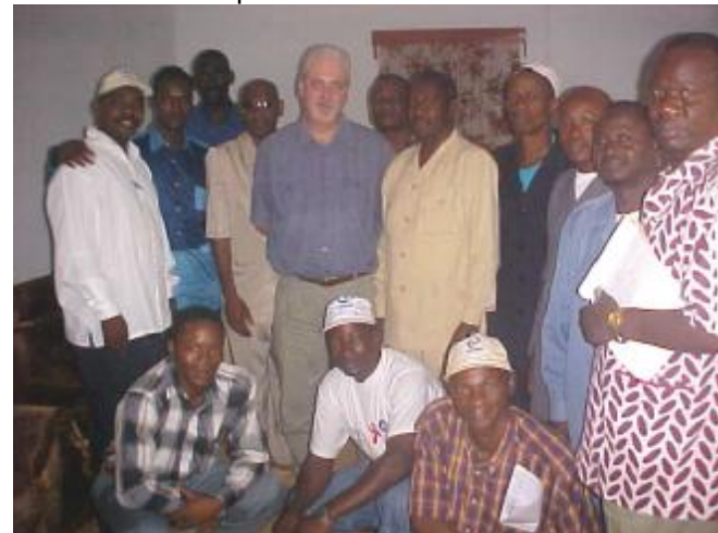
Le Directeur Régional entouré des autorités préfectorales de Kissidougou

La visite étant courte, il m'est difficile de faire des commentaires, d'une manière bien informée, sur la qualité du Programme et de l'efficacité de la production des Communications. Néanmoins, j'ai été très impressionné par le comportement, le dévouement et l'enthousiasme de tous à Plan Guinée, que ce soit le personnel, les partenaires, les enfants, les jeunes ainsi que les communautés rencontrés. Je suis sûr que ce que j'ai vu est le meilleur guide à la qualité des activités menées par Plan en Guinée.