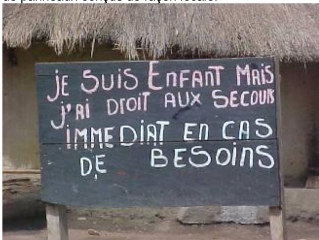
Un exemple de panneau

L a communauté de Yombiro est l'une des communautés partenaires de Plan Guinée qui essaye de prouver de façon concrète sa compréhension du CCCD à travers ces genres de panneaux conçus de façon locale.