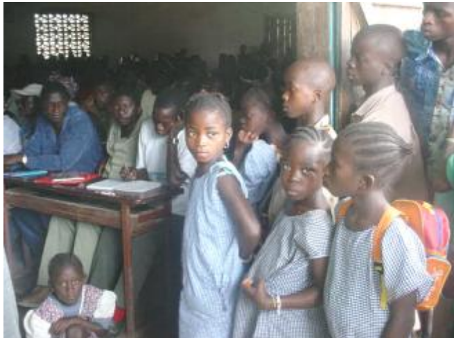
Parents et élèves sont venus suivre les différentes activités