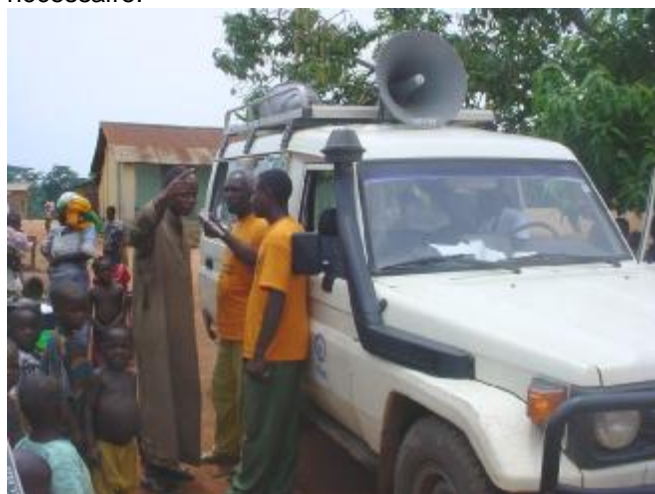
Un leader communautaire intervient au moment de la sensibilisation

Dans le but de mener à bien l'enregistrement des naissances dans les CRD de Yomou et N'Zérékoré, une forte responsabilisation des leaders communautaires et officiers de l'état civil est nécessaire.