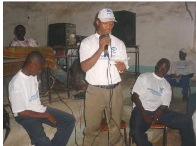
Les Messagers de PARTENARIAT de Macenta Tribune ont participé à la réussite de la Campagne