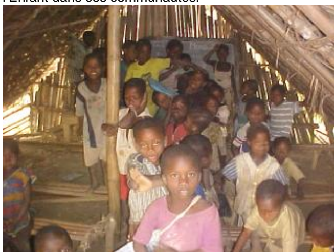
Les enfants du jardin

De telles initiatives sont à encourager dans nos communautés car c'est un signe de reconnaissance des efforts que Plan Guinée déploie sur le terrain, à travers ses agents qui ne ménagent aucun effort pour l'acheminement des informations sur les droits de l'Enfant dans ces communautés.