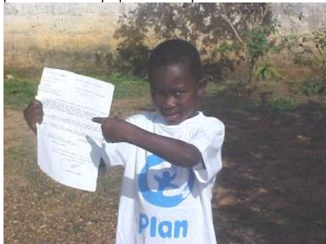
J'ai mon extrait de naissance

C onscients que l'enregistrement à la naissance est le premier droit de l'enfant, et travaillant directement avec les enfants, les enseignants et directeurs d'écoles ont compris la nécessité pour eux de s'impliquer dans la promotion de celui-ci.