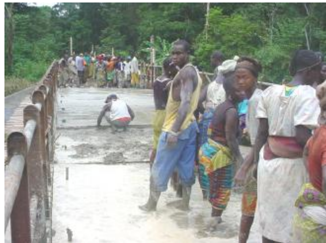
Le pont de yézou pendant le coulage (29 juin 2004)

Concernant les infrastructures routières, un pont de 29 mètres a été réalisé à Yézou dans la CRD de Fasciation et l'achèvement du remblayage de 14 dalots sur la route de Binikala.