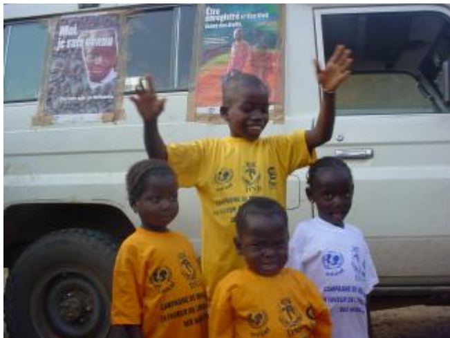
Les enfants ont participé à la campagne de sensibilisation sur les extraits de naissance

L'importance d'un extrait de naissance est capitale car la durée de la vie de l'homme ne peut être exactement connue sans ce document. Il est indispensable pour l'établissement d'une carte d'identité nationale, d'un passeport, d'un certificat de nationalité, la scolarisation en dépend. Dans les Communautés Rurales de Développement de la zone Plan, pour bénéficier des primes d'encouragement du fonds éducatif il faut ce document.