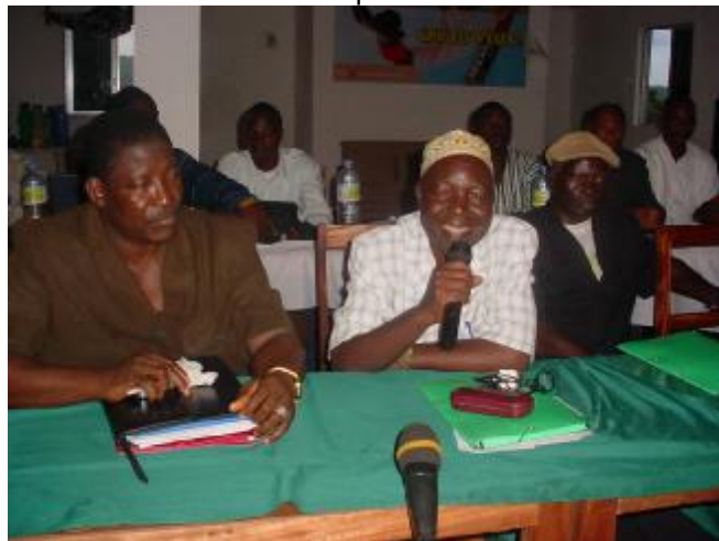
Vue partielle de la salle

Faciliter le processus de l'enregistrement des naissances à tous les niveaux en guinée de façon générale et en guinée forestière en particulier pour permettre à tous les enfants guinéens d'avoir un acte de naissance valable à un prix abordable.