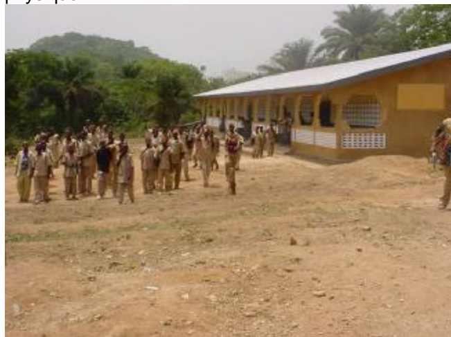
Les élèves des générations futures

Tu nous as fourni des écoles et des enseignants. Par ce que l'éducation est la racine du développement. Tu nous as fourni des postes de santé et des agents de santé. Par ce que la santé donne l'aptitude morale et physique.