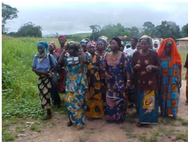
Les accoucheuses villageoises après la formation

fonctionnement ), celle de la grossesse et le suivi d'une femme en grossesse, les maladies fréquentes chez une femme en grossesse, l'enregistrement des naissances et la conduite à tenir devant chaque cas. D'autres thèmes sont venus compléter la connaissance des accoucheuses villageoises comme : le rôle qu'elles doivent jouer dans le suivi des femmes en grossesse, les facteurs de risque chez les femmes en grossesse et les conséquences, l'hygiène et l'alimentation de la femme en grossesse, les préparatifs de l'accouchement, le suivi du bébé et de la mère, l'importance de l'allaitement maternel, leur rôle dans la mobilisation sociale pour les programmes de stratégies avancées (vaccination), le suivi nutritionnel et la promotion des extraits de naissance.