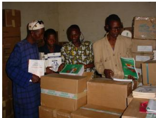
Les membres L'APEAE préfectorale observent les manuels lors de la remise

apprentissage qui est l'un des objectifs du Programme Enseignement Pour Tous.