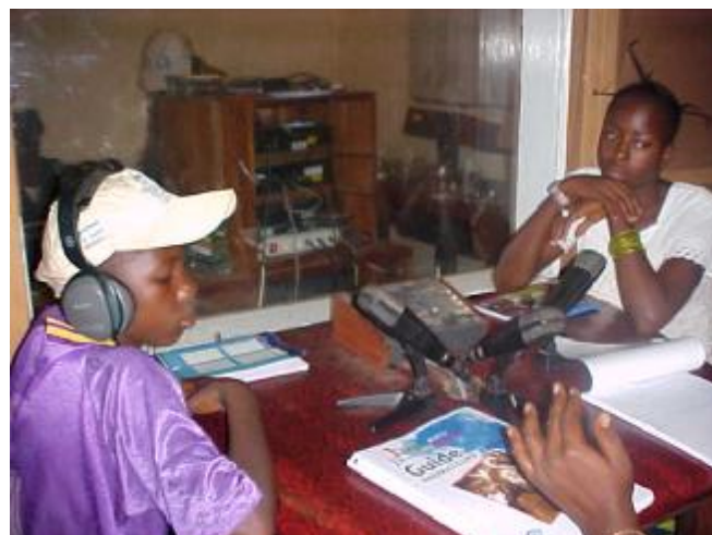
Les enfants participent à l'animation des différentes émissions