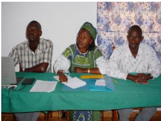
Les responsables de la comptabilité à PlanGuinée

L es Coordinateurs, Administrateurs et Assistants de Zones ainsi que les représentants des ONG partenaires : Transparency Consulting ( TransCons ), l'Association des animateurs Communautaires de Guinée ( A.A.C.G ), le Groupement des prestataires de Guinée ( G.P.S ), le Groupement des animateurs Communautaires pour les Bonnes oeuvres ( G.A.Co.Bo ), Zalikwèlè animateurs Communautaires ( Zali.A.C ), et WEST Ingénierie ont suivi du 18 au 22 octobre à l'Hôtel Mantis Palace, une formation de rafraîchissement de mémoire.