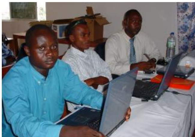
Quelques participants à la formation

La politique de voyage ( formulaire de voyage ), la politique d'avance sur salaire, la politique de cession de laptop, les congés ( formulaire de congés ) et Le loss notification ont édifié les participants sur certaines pratiques.