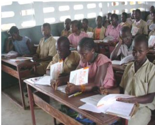
Les élèves avec les manuels scolaires

Au cours de la Cérémonie de remise, le Superviseur du Programme Amélioration de la Qualité de l'Enseignement ( SPAQE ) a manifesté sa satisfaction en précisant que les manuels mis à la disposition de la Direction Préfectorale de l'Education serviront non seulement aux élèves mais aussi aux enseignants pour que le niveau de l'enseignement soit de qualité.