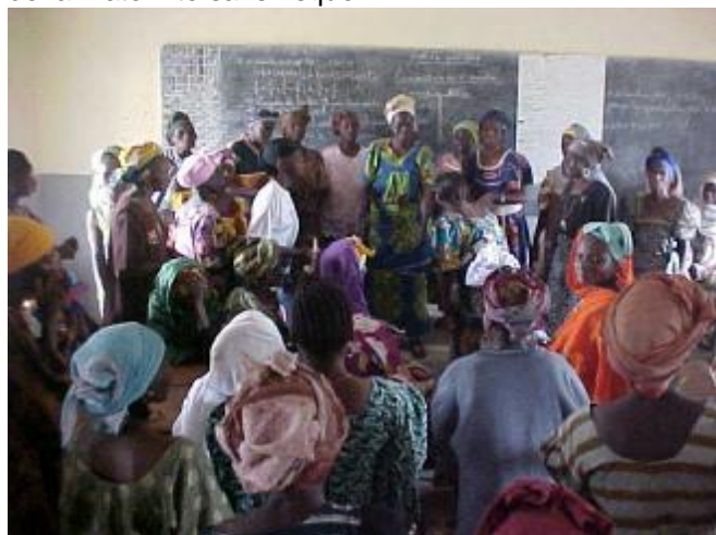
Les accoucheuses villageoises réunies pour les séances pratiques

L a direction préfectorale de la santé de macenta, et les communautés rurales de développement (CRD) avec l'appui de PlanGuinée ont organisé du 30 / 08 au 20 / 09 / 04 deux séances de formation des accoucheuses villageoises. La première qui a eu lieu dans la salle de formation de la Direction Préfectorale de la Santé s'inscrivait dans le cadre de la formation des formatrices. Elle a regroupé 24 participants et la formation a été assurée par une formatrice nationale de la maternité sans risque.