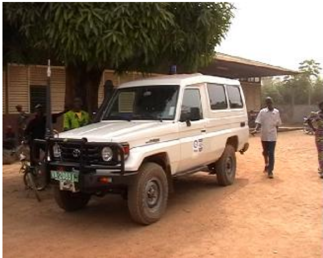
L'ambulance mise à la disposition de l'hôpital

Donc, je ressens une grande satisfaction. Une satisfaction par rapport à ce qui est fait, par rapport à ce qu'on attend, en utilisant tout ce qui a été mis à notre disposition.