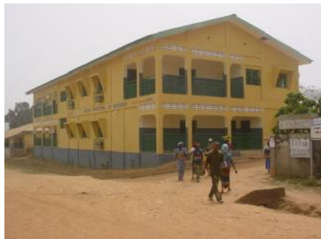
La polyclinique de Gueckédou

<< Pour le seul semestre après l'inauguration de cet hôpital, nous sommes à 47 millions de recettes. C'est dire toute l'importance que nous accordons à cette polyclinique >>.