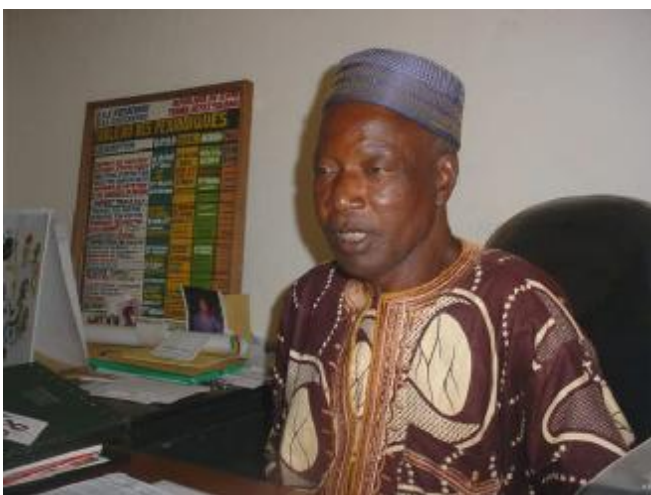
Le DPE de Gueckédou

Donc ce bijou est précieux. Il n'est même pas à comparer à l'ancien bâtiment qui était là de par ses compartiments qui sont plus nombreux que le premier bâtiment, qui sont plus évasés et mieux équipés en mobiliers, en ordinateur. Quand on est dans ce bureau on a pas de la chaleur grâce aux dispositions prises par PlanGuinée et l'USAID.