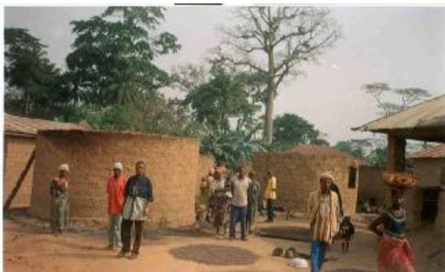
Les habitants de Beindou constatent les dégâts après l'incendie

Un incendie au bilan bien lourd s'est produit dimanche 02 janvier 2005 vers 13 heures.